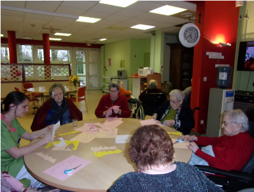
Des ribambelles de lapins en papier