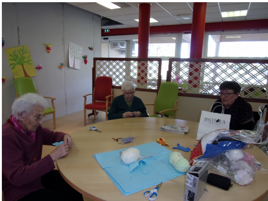
Des ribambelles de lapins en feutrine